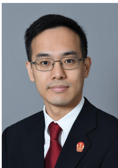
葛翔，上海金融法院综合审判三庭副庭长，三级高级法官。