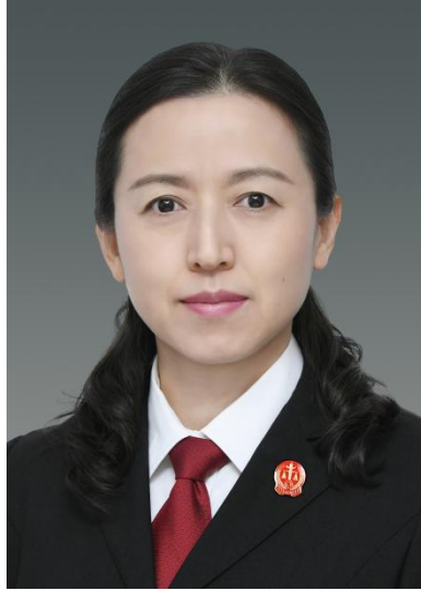
单素华，上海金融法院副院长，审判委员会委员，二级高级法官。