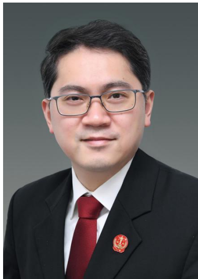
符望，上海金融法院审判委员会专职委员，二级高级法官。