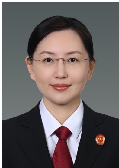
孙倩，上海金融法院综合审判一庭副庭长，三级高级法官。